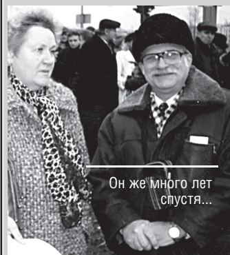
Он же много лет спустя...