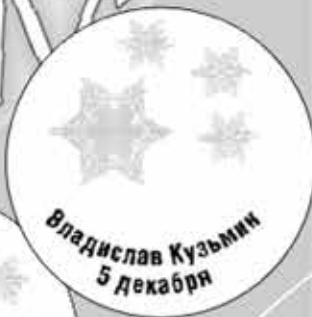
Владислав Кузьмин 5 декабря