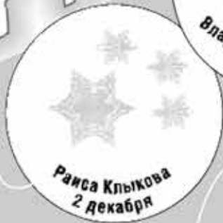
Раиса Клыкова 2 декабря