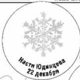
Настя Юдинцева 22 декабря